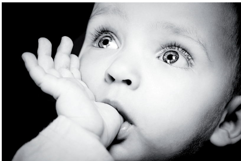
4.46. # 11309503

Fotografowanie dzieci jest kolejną kategorią uwieczniania postaci za pomocą zdjęć. Dlaczego fotografowanie dzieci omawiam w osobnym punkcie? No cóż, są one szczególną grupą modeli, a wykonanie im zdjęcia wymaga zastosowania odpowiednich technik i przygotowania. Fotograf podejmujący się tego zadania powinien wykazać się cierpliwością, poczuciem humoru oraz umiejętnością przyciągania uwagi dziecka. Przydaje się to podczas portretowania milusińskich, zwłaszcza tych w młodszym wieku. Doskonale w takich sytuacjach sprawdzają się obiektywy umożliwiające zmianę ogniskowej. Pozwalają one na fotografowanie bez konieczności zbliżania się do modela — gdy chcemy wypełnić kadr samą twarzą modela (stosujemy wówczas największy dostępny w aparacie zoom optyczny) (fotografia 4.46) — i odsuwania się od niego, gdy zechcemy umieścić w kadrze całą jego sylwetkę (stosujemy mniejszy zoom).